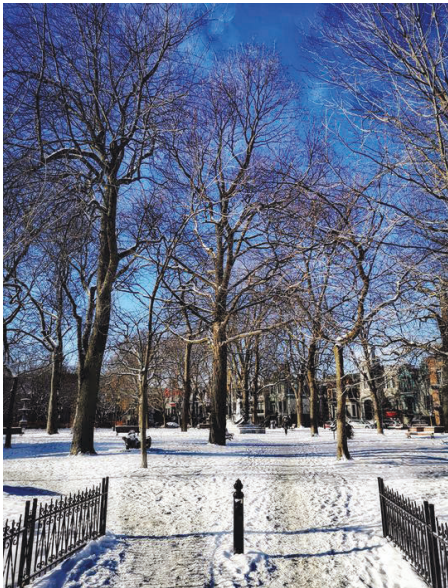
Âme culturelle de Montréal

LA PETITE COLONIE des Franco-Manitobains, à l'instar des autres, se connaissait et s'entraidait. Dugas se souvient d'avoir transporté dans sa fourgonnette les grandes toiles de Pauline Morier, de galerie en galerie. Ah! La bohème que les moins de vingt ans ne peuvent pas connaître!